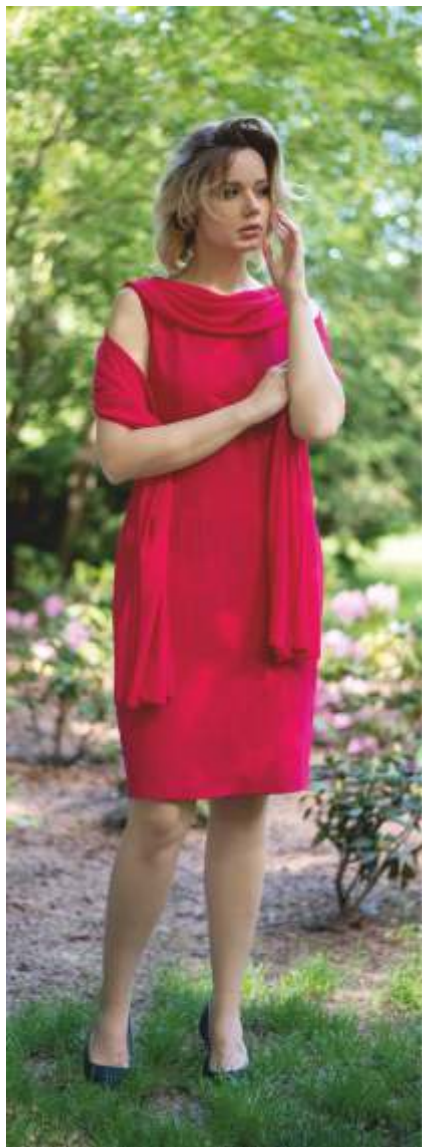
18/ Sara II