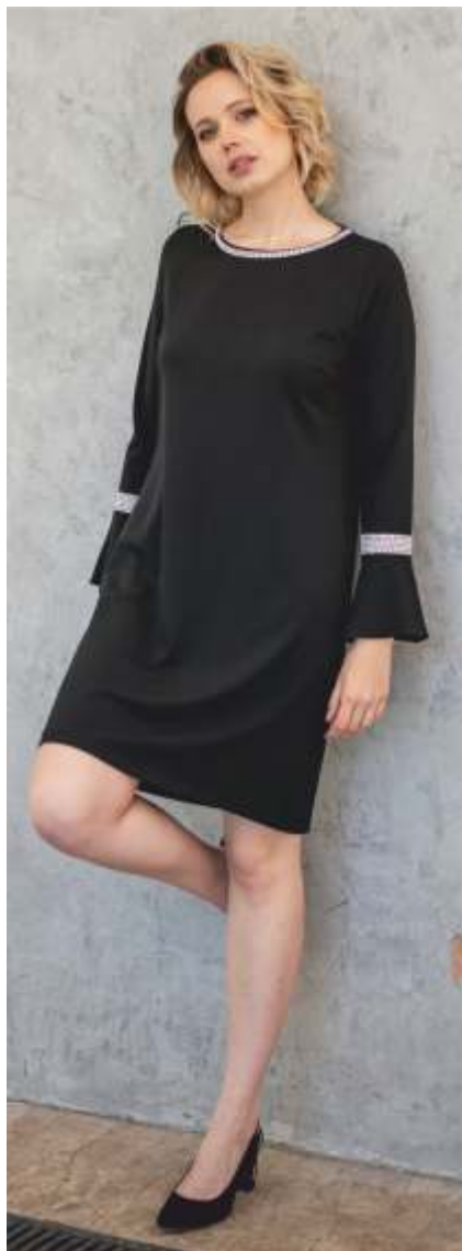
20/ Maja II